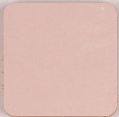
ACS 35 (40 мл)