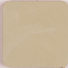
ACS 71 (40 мл)