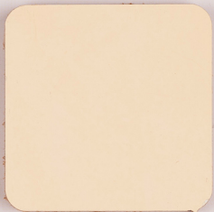
ACS 103 (40 мл)