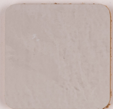
ACS 76 (20 мл)