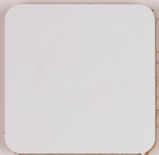
ACS 45 (20 мл)