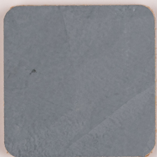
ACS 75 (80 мл)