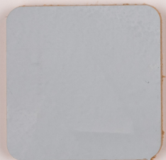
ACS 75 (20 мл)