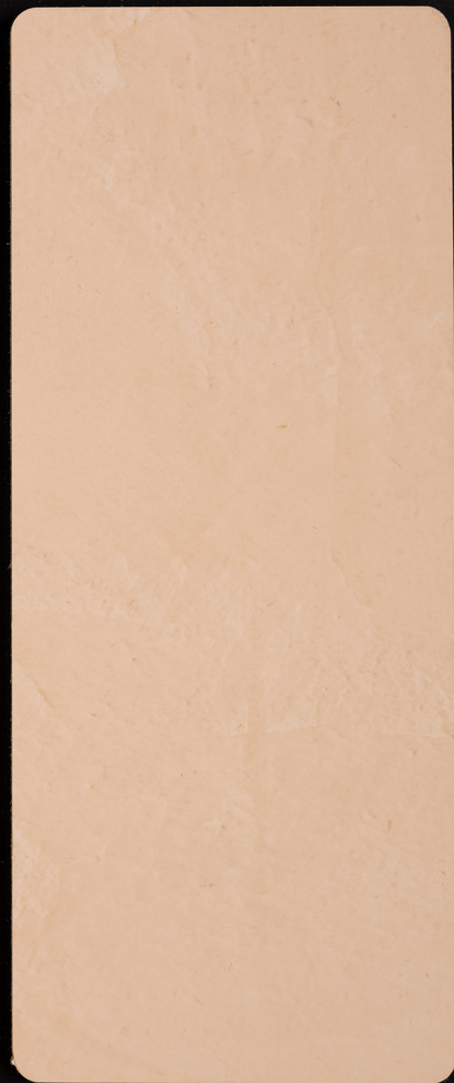
ACS 29 (80 мл) / Бокс LUBA