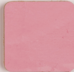
ACS 100 (40 мл)