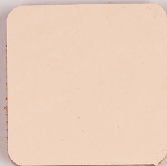
ACS 105 (40 мл)