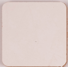
ACS 35 (10 мл)