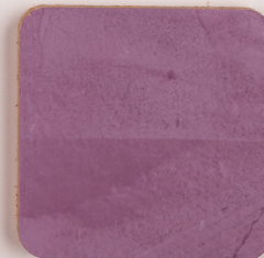
ACS 173 (40 мл)