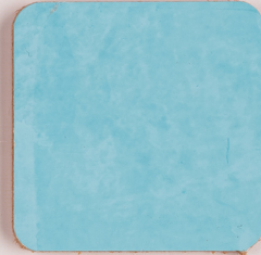
ACS 107 (40 мл)