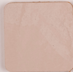
ACS 69 (20 мл)