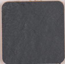
ACS 94 (160 мл)