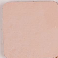
ACS 39 (20 мл)