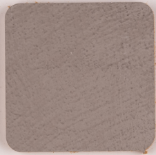
ACS 76 (80 мл)