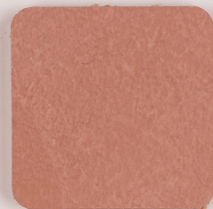
ACS 39 (80 мл)