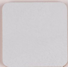
ACS 45 (80 мл)