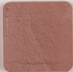
ACS 72 (80 мл)