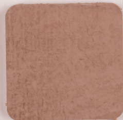
ACS 69 (80 мл)