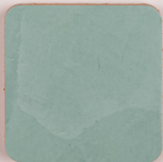
ACS 90 (40 мл)