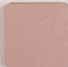
ACS 72 (20 мл)