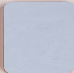
ACS 41 (40 мл)