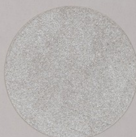
ACS 67 (10 мл)