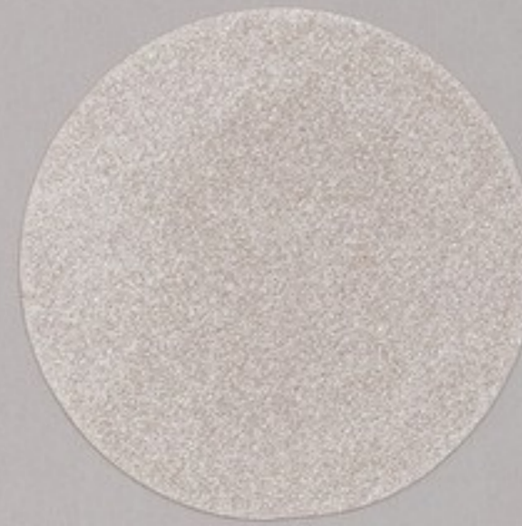
ACS 29 (20 мл)