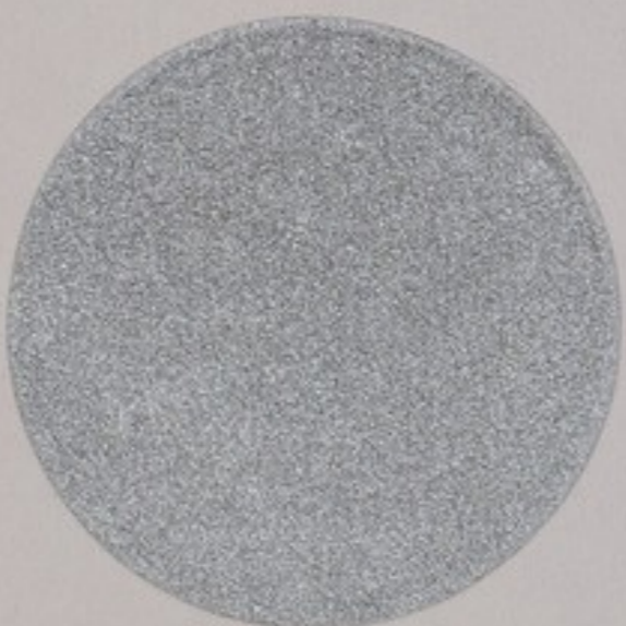
ACS 64 (20 мл)