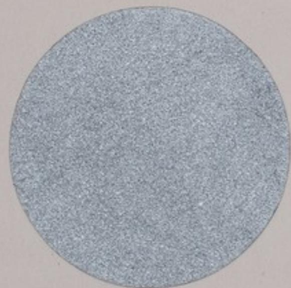
ACS 75 (20 мл)