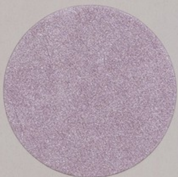
ACS 173 (5 мл)