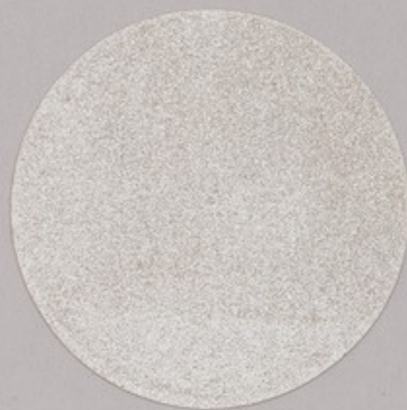
ACS 49 (10 мл)