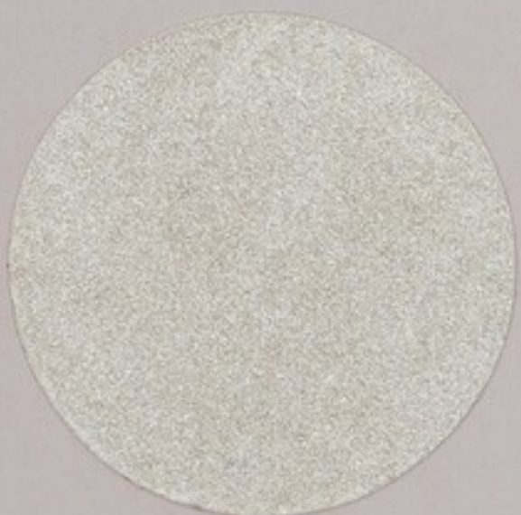
ACS 91 (5 мл)