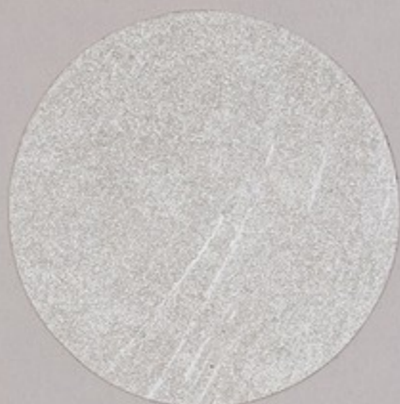
ACS 7 (10 мл)