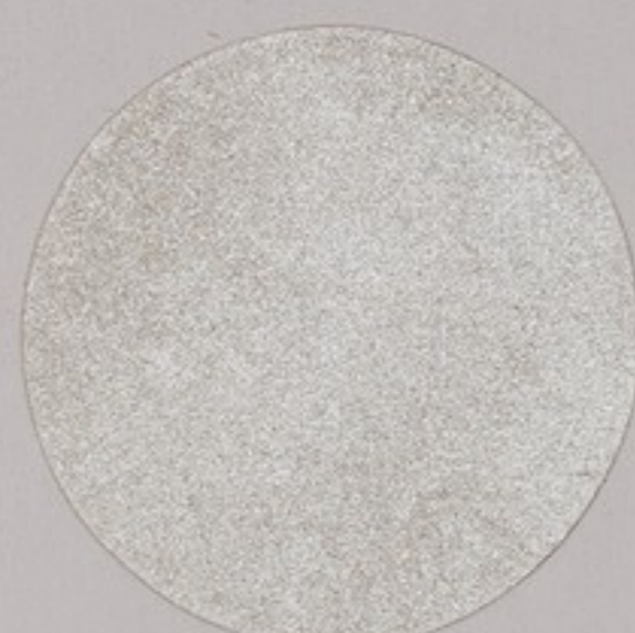
ACS 51 (20 мл)