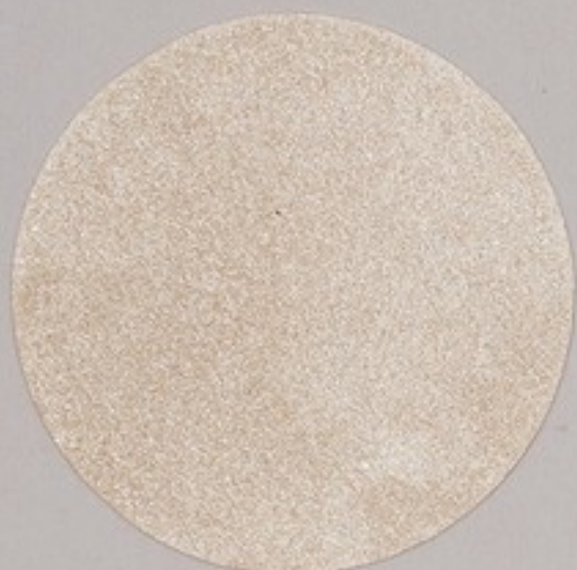
ACS 104 (20 мл)