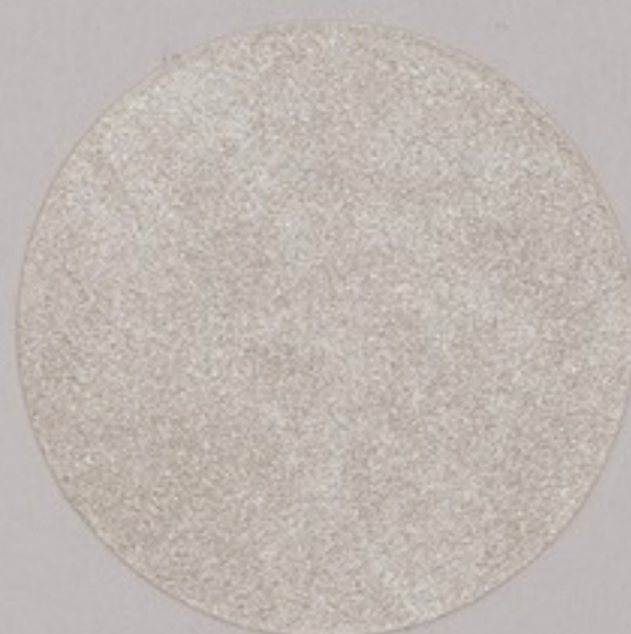
ACS 165 (20 мл)