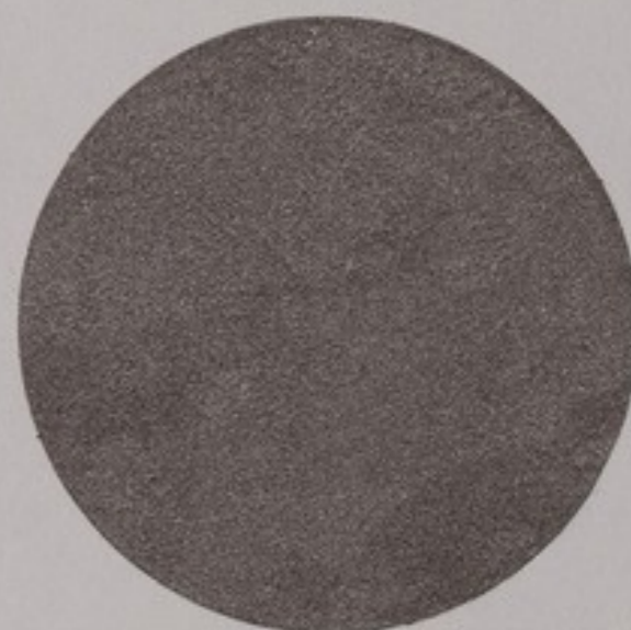
ACS 69 (320 мл)