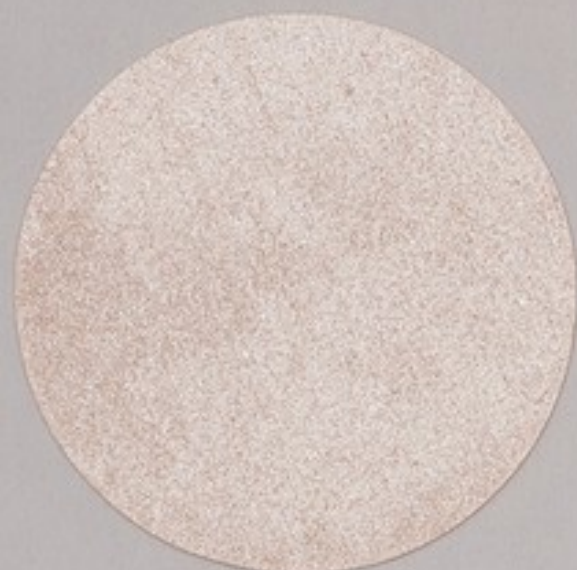
ACS 105 (30 мл)

АСТИ ВЕЛЮР ПРИМА – пастообразное покрытие с перламутровым эффектом. Материал создает поверхности с мелкорельефными фактурами, имитацией под шелк или карту мира.