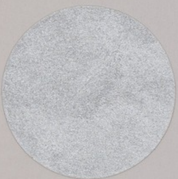
ACS 118 (20 мл)