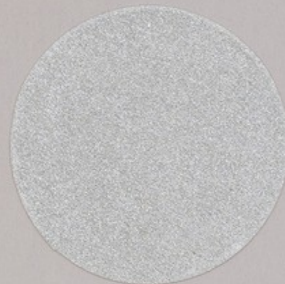
ACS 8 (20 мл)