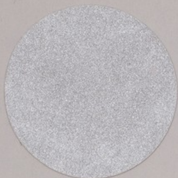
ACS 47 (10 мл)