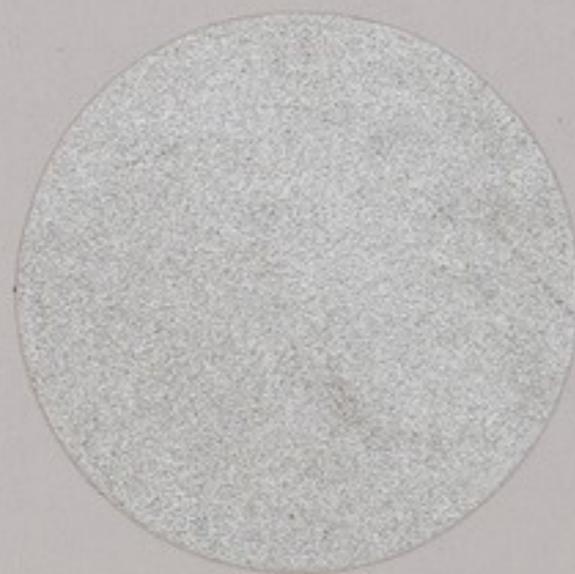
ACS 6 (20 мл)