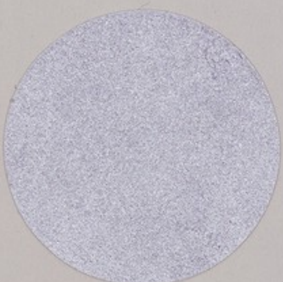
ACS 24 (20 мл)