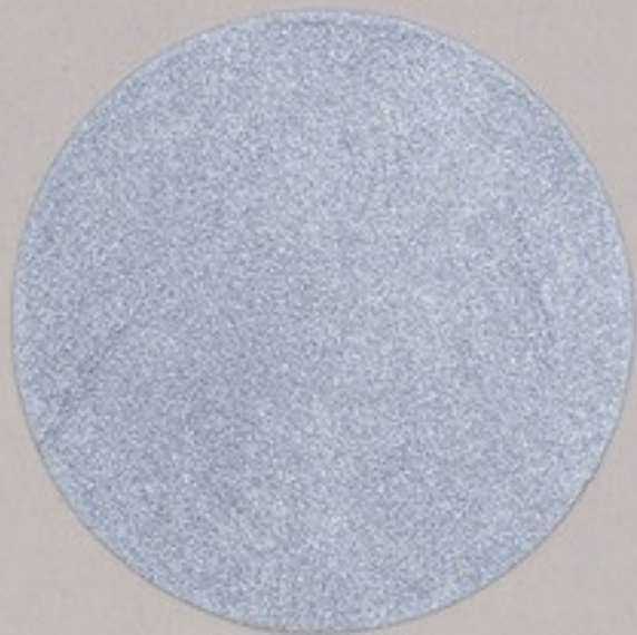
ACS 171 (5 мл)