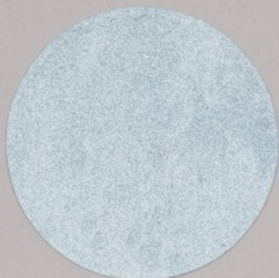
ACS 107 (5 мл)