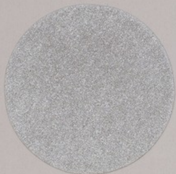
ACS 76 (10 мл)