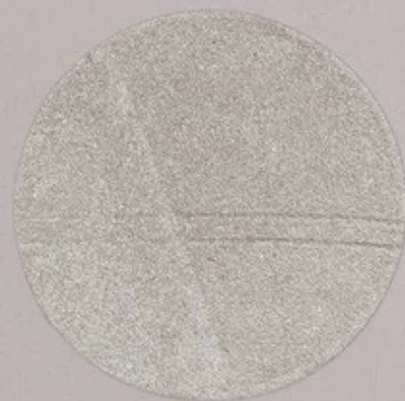
ACS 71 (10 мл)