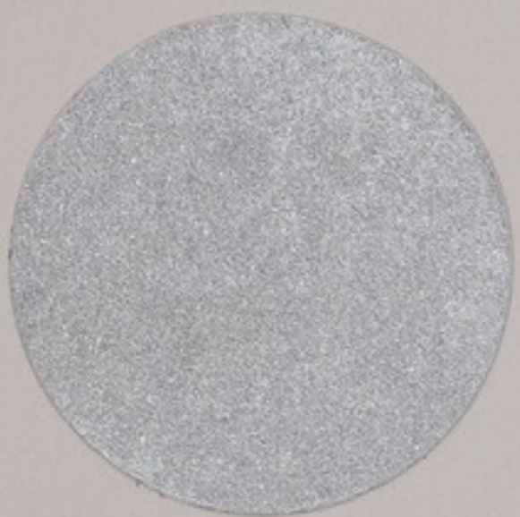
ACS 65 (10 мл)