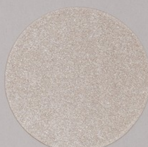
ACS 32 (10 мл)